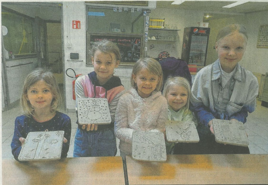
Beaucoup de jeunes ont participé au projet.

Depuis janvier, une centaine de personnes ont donné un peu de leur temps et laissé libre cours à leur créativité pour créer des céramiques. Celles-ci seront utilisées pour décorer les murs intérieurs de la petite chapelle de Semel, dans la commune de Neufchâteau. Derrière ce projet de restauration, on retrouve l'ASBL Rural alternatif, qui souhaite faire du lieu « une halte artistique, culturelle et spirituelle ouverte à toutes les sensibilités ». « Par cette action, nous réinventons de manière originale un avenir à du petit patrimoine religieux souvent délaissé », explique l'association sur son site internet. Le thème symbolique qui a été retenu est celui des saisons.